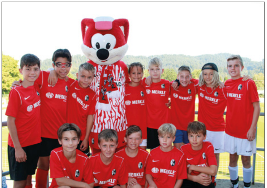
Die U12 des FC 03 beim Füchsletag des SC Freiburg