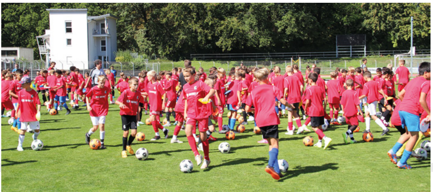
Zahlreiche Kinder beim Füchsletag